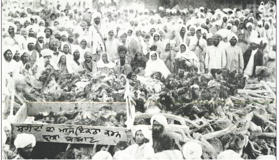
ਸ਼ਹੀਦੀ ਅੰਗੀਠਾ ਜਿੱਥੇ ਸ਼ਹੀਦਾਂ ਦੀਆਂ ਦੇਹਾਂ ਦਾ ਸਮੂਹਿਕ ਸਸਕਾਰ ਕੀਤਾ ਗਿਆ।

ਨ ਨਕਾਣਾ ਸਾਹਿਬ ਗੁਰੂ ਨਾਨਕ ਦੇਵ ਜੀ ਦਾ ਜਨਮ-ਅਸਥਾਨ; ਪਾਕਿਸਤਾਨ ਦੇ ਜ਼ਿਲ੍ਹੇ (ਸ਼ੇਖੂਪੁਰਾ) ਦਾ ਕਸਬਾ ਹੈ। ਪੰਦਰਵੀਂ ਸਦੀ ਵਿਚ ਇਸ ਕਸਬੇ ਨੂੰ ਤਲਵੰਡੀ ਰਾਇ ਭੋਇ ਜਾਂ ਰਾਇ ਭੋਇ ਕੀ ਤਲਵੰਡੀ ਕਿਹਾ ਜਾਂਦਾ ਸੀ। ਜਦੋਂ ਗੁਰੂ ਨਾਨਕ ਦੇਵ ਜੀ ਦੇ ਪੁੱਤਰ ਬਾਬਾ ਲਖਮੀ ਦਾਸ (1497-1555) ਜਾਂ ਪੋਤਰੇ ਬਾਬਾ ਧਰਮ ਦਾਸ (1523-1618) ਨੇ ਕੋਠਾ ਛੱਤਿਆ ਤਾਂ ਉਸ ਵੇਲੇ ਇਸ ਸਥਾਨ ਨੂੰ ਕਾਲੂ ਕਾ ਕੋਠਾ ਕਿਹਾ ਜਾਂਦਾ ਸੀ। ਗੁਰੂ ਨਾਨਕ ਦੇਵ ਜੀ ਦੇ ਪਿਤਾ ਦਾ ਨਾਮ ਮਹਿਤਾ ਕਾਲੂ ਸੀ। ਬਾਅਦ ਵਿਚ ਇਸ ਜਨਮ-ਅਸਥਾਨ ਨੂੰ ਨਨਕਿਆਣਾ ਕਿਹਾ ਜਾਣ ਲੱਗ ਪਿਆ।